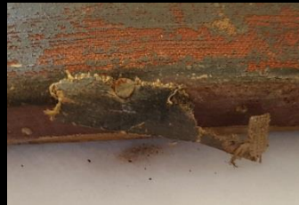
Restos otro lienzo